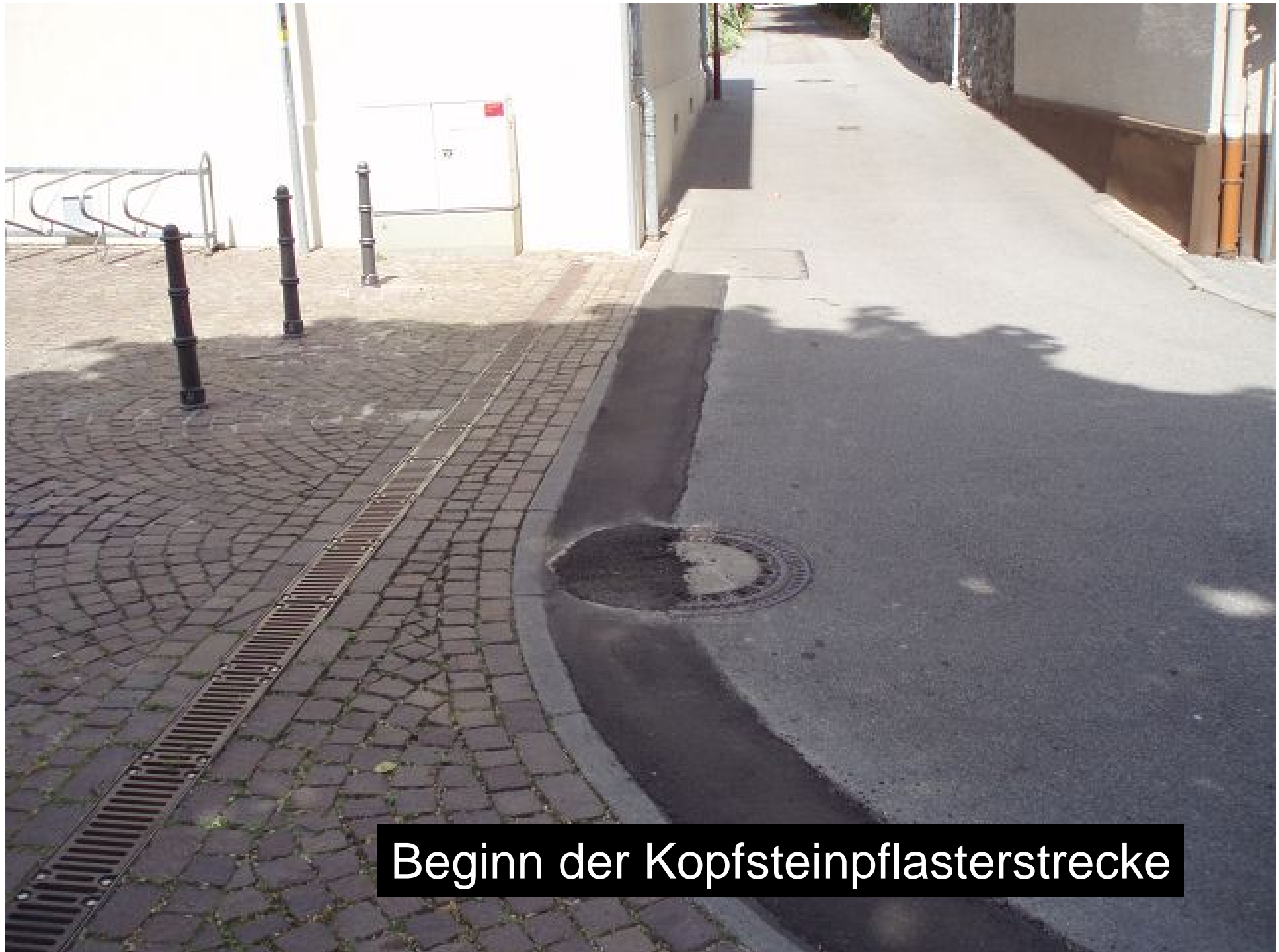
Beginn der Kopfsteinpflasterstrecke