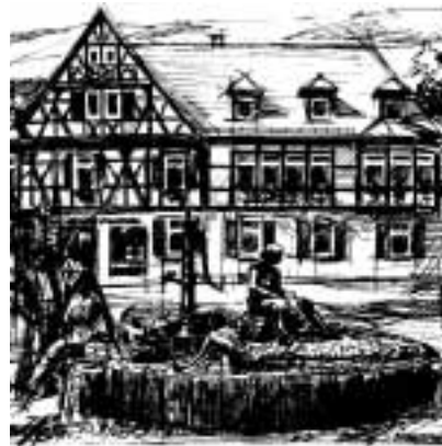
Der Lorsch Tabakbrunnen ist der Beharrlichkeit der SPD-Kommunalpolitiker zu verdanken

Wenn eine Partei im Rahmen eines Jubiläums eine Rückschau hält auf die eigene Politik, dann sieht sie im Regelfall nur das Positive, das geleistet wurde. Auch die Autoren der Jubiläumsschrift "100 Jahre SPD" sind da nicht unanfällig. Dennoch wollen wir hier feststel-