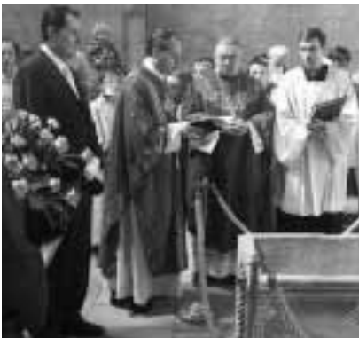
Karl Kardinal Lehmann bei der Statio im Kirchenrest.

Mit einer Statio im Kirchenrest begann das Pontifikalamt am Pfarrfest-Sonntag. Den Anlass zu diesen Feierlichkeiten im Rahmen unseres Pfarrfestes bildeten die 1700 Jahrfeier zum Todestag unseres Patrons St. Nazarius und der Besuch unseres Bischofs Karl Kardinal Lehmann.