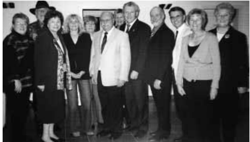
Das Foto zeigt die Helfer und die Verantwortlichen für das Gelingen der Veranstaltung

Allen, die dem Aufruf für die New Orleans Opfer zu spenden gefolgt sind und damit einen Beitrag zu dieser Aktion geleistet haben, herzlichen Dank.